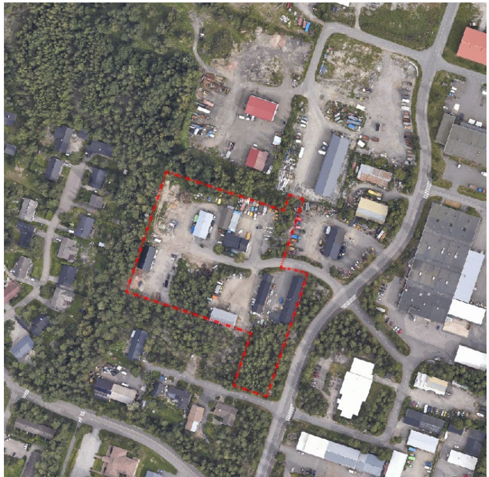
Suunnittelualue ilmakuvalla 2023