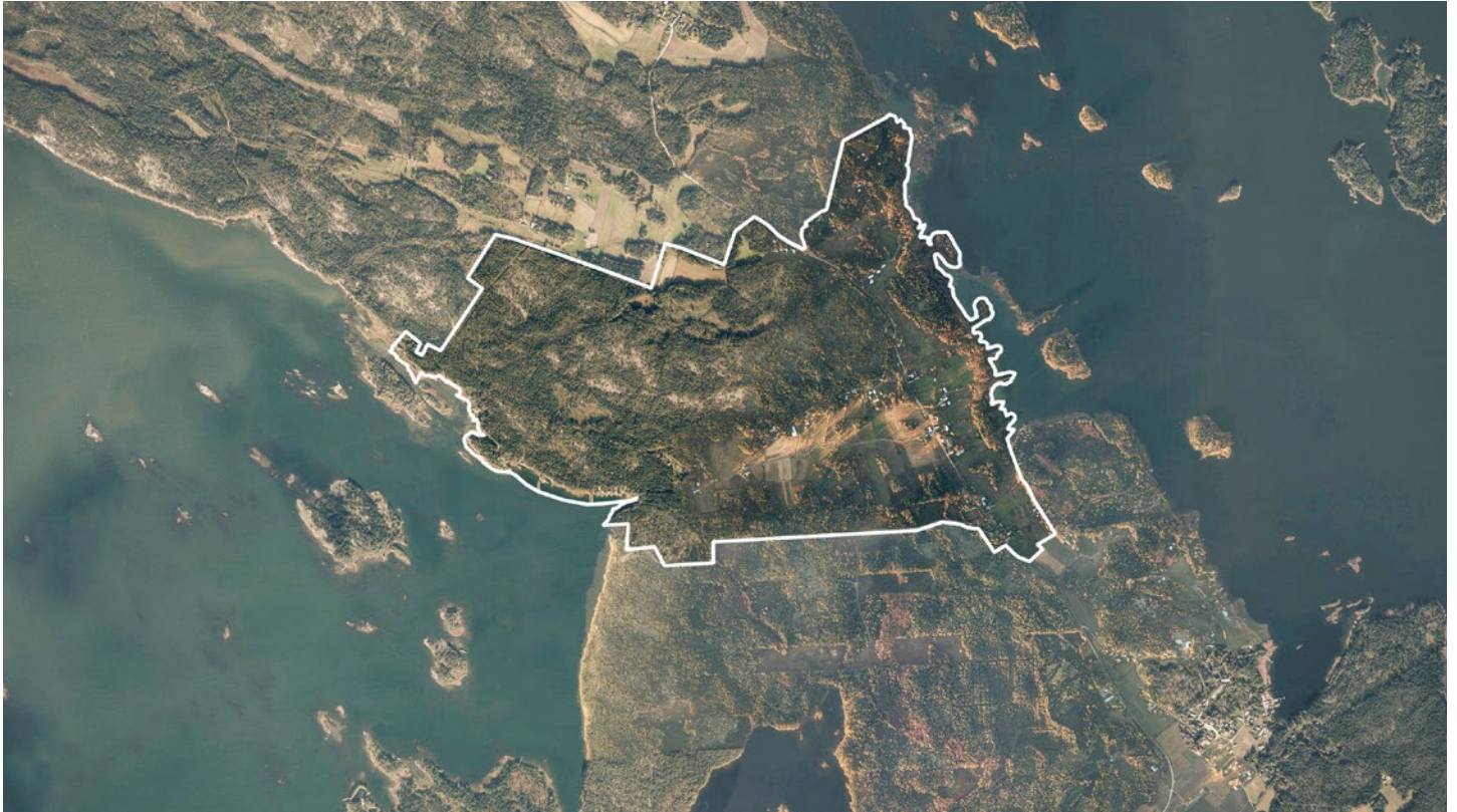
Ilmakuva Pyhämaasta. Suunnittelualue rajattuna kuvassa.