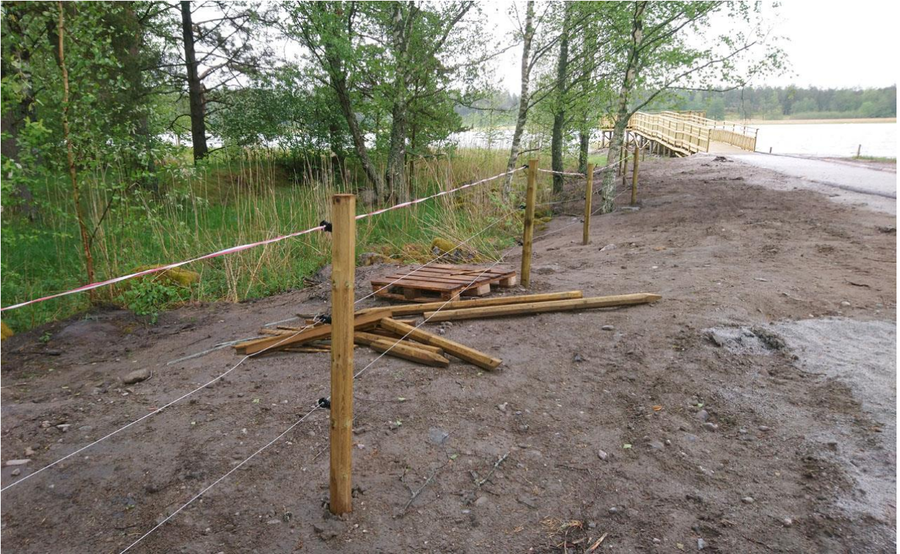
Kuva: karja-aita valmistumassa 1.6.2022. Taustalla Kasarminlahti ja Leader -rahoituksella toteutettu esteetön lintulava (punainen piste kartalla 1)

Hankeen viimeisenä työnä pohdittiin ja mitoitettiin vedenkorkeuden säätelyä raviradan kosteikon osalta. Kosteikko ennallistui hienoksi ojia tukkimalla ja valuma-alueen vesiä ohjailemalla ja säilyi lähes koko kesän 2022 lievästi tulvivana. Muutaman viikon kosteikko oli riittävän kantava naudoille. Sinänsä tulviminen on toivottava asia kosteikolla, mutta jatkohoidon turvaamisen näkökulmasta vettä on tarvetta laskea esim. loppukesäisin, jotta karjankasvattaja uskaltaa laiduntaa aluetta. Ratkaisuksi on kaavailtu munkkipatoa ja virtausrummun suurentamista Vionojaan valuvassa ojassa. Aika ja rahoitus eivät enää toteutukseen riittäneet, mutta toimenpiteelle on jo haettu lisärahoitusta.