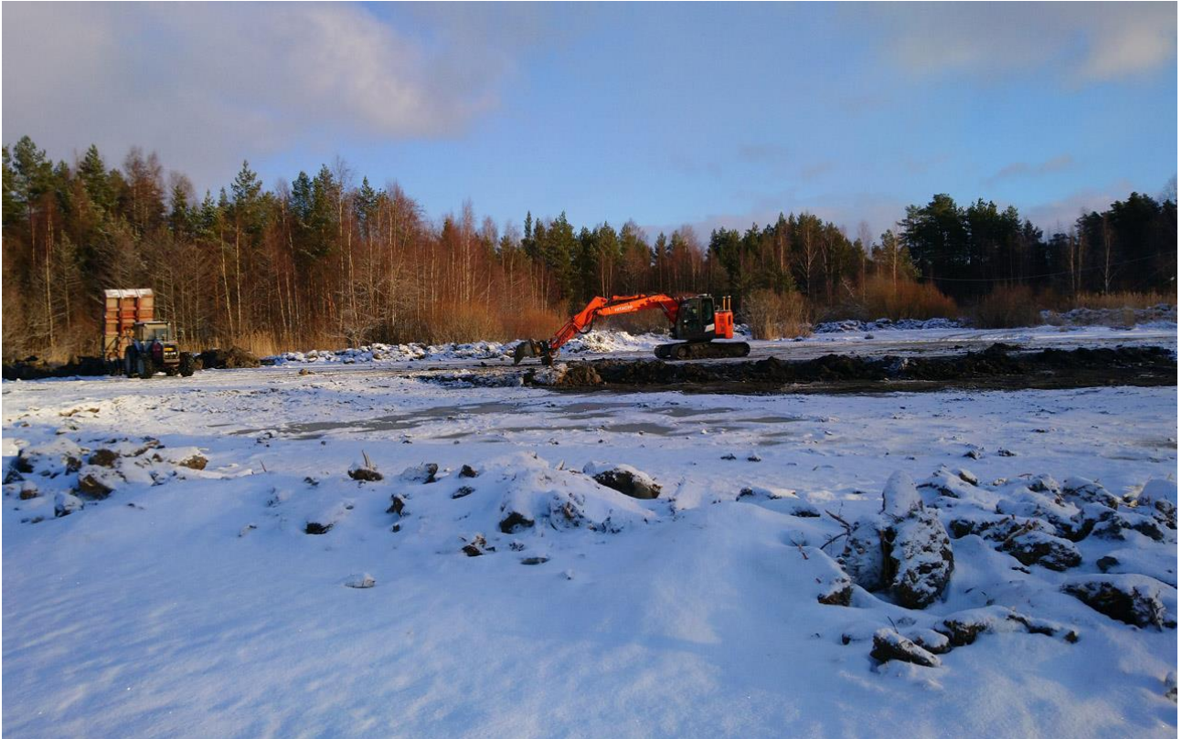
Kuva: syvänteiden kaivuuta tammikuussa 2022