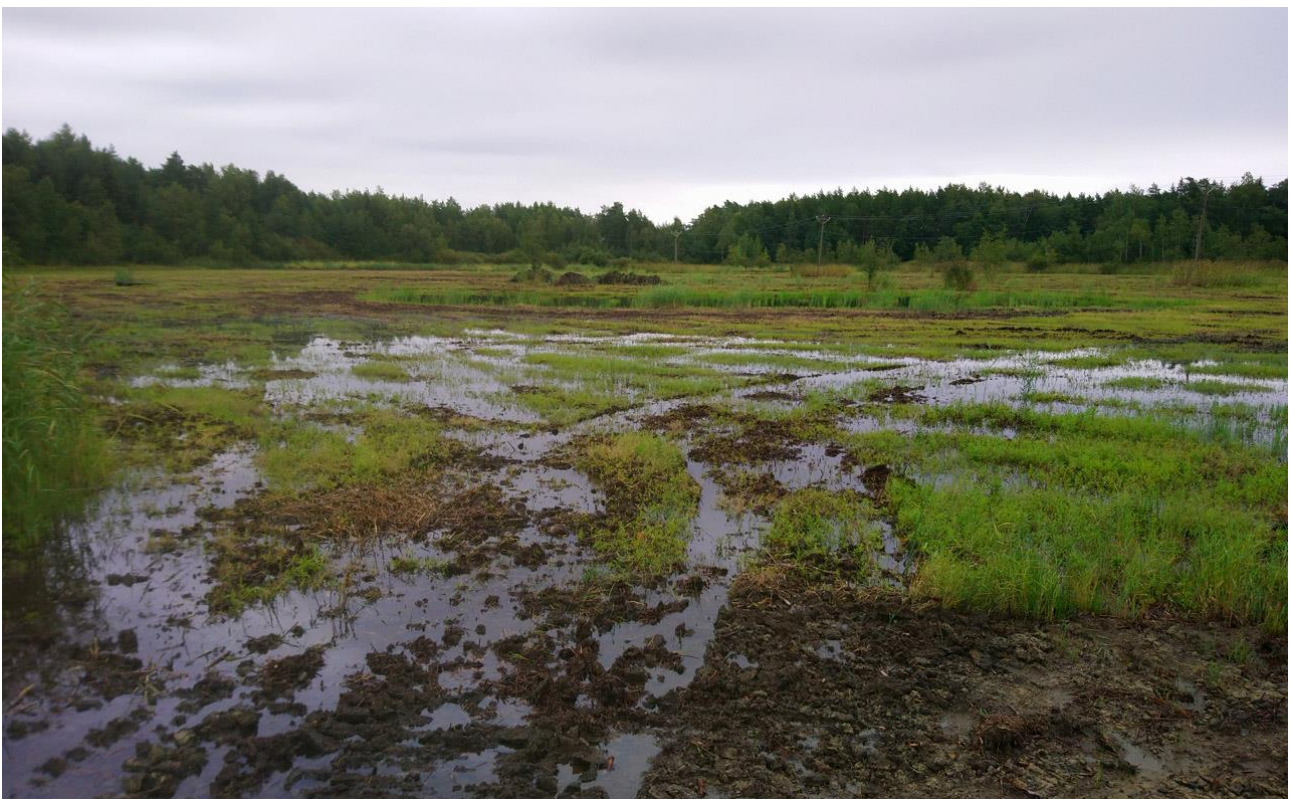
Kuva: Sama maisema kuin edellisessä kuvassa 24.8.2022 kuvattuna