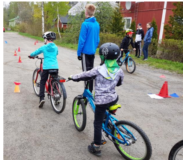
Liikunnallisen elämäntavan oppiminen saa alkunsa perheen päivittäisistä rutiineista ja liikkumistottumuksista.